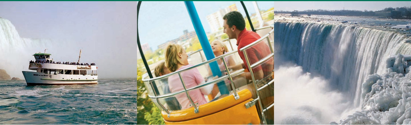
V. l. n. r.: Maid of the Mist, Clifton Hill, Niagarafälle

Niagara Falls • Niagara-on-the-Lake • St. Davids • Jordan • Vineland